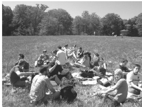
Gemeinsames CKJ/MJK-Treffen am 1. Mai