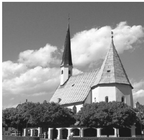
Gnadenkapelle in Altötting und Marienheiligtum der neu gegründeten MJK Altötting